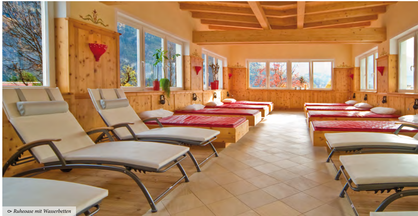
☞ Ruheoase mit Wasserbetten