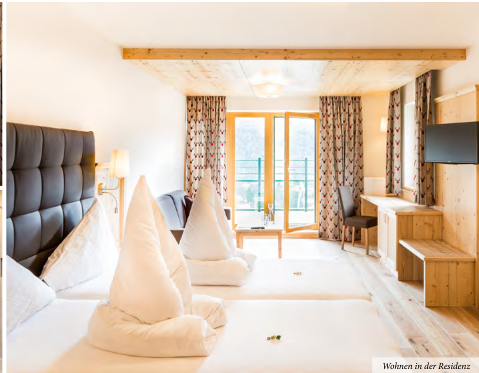
Wohnen in der Residenz