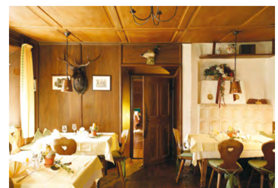
Banderstube anno 1822

Wir servieren durchgehend warme Speisen. Bis 23.00 Uhr!