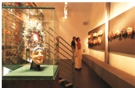
Fasnachtsmuseum – original Imster Brauchtum