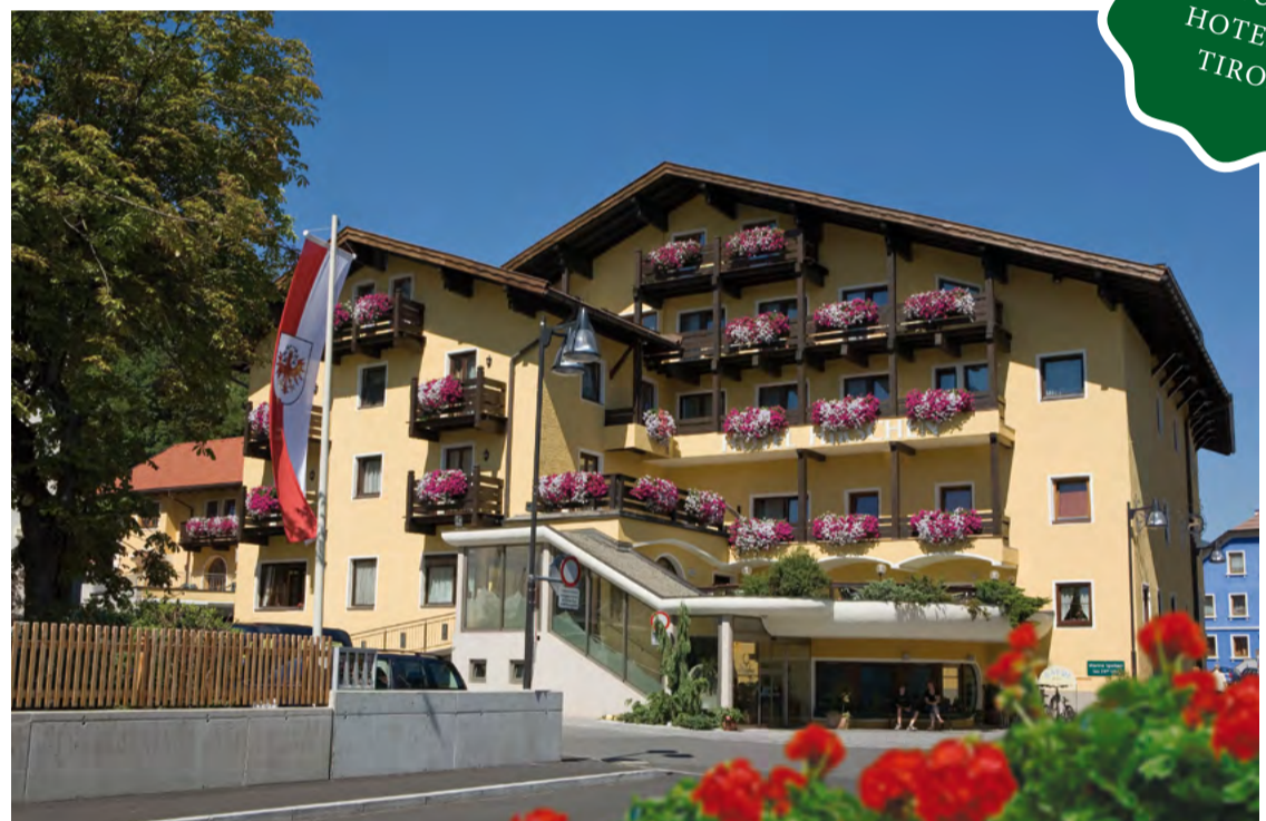
Traditioneller Gasthof neben der Pfarrkirche Imst - Oberstadt.