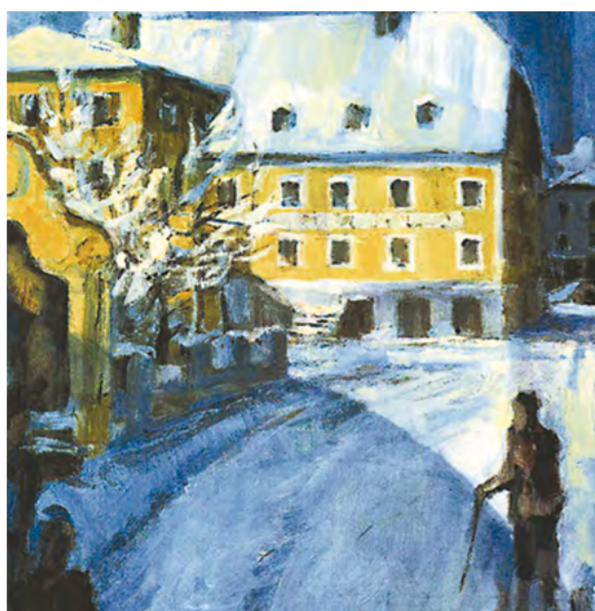
Poststation – Bandweberei – Gasthof