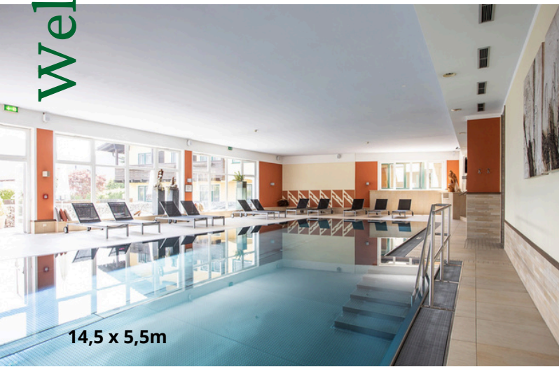
14,5 x 5,5m